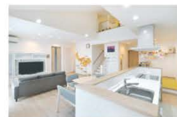
回遊できる便利なアイランド型の対面キッチン。ご夫妻が並んで利用することも多い