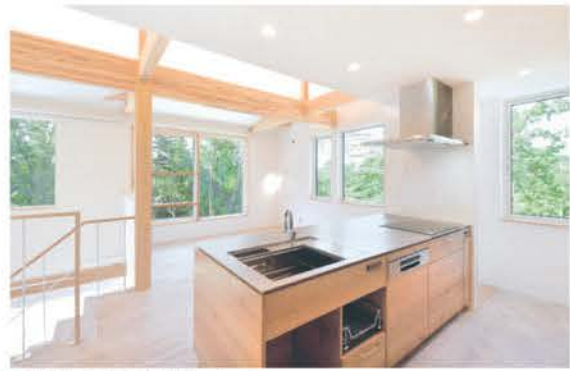
■ 空間に調和する木目のキッチン