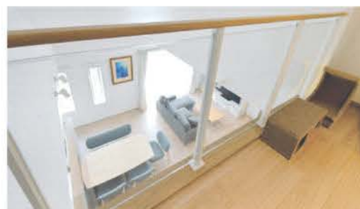
小屋裏は子どものプレイルーム兼収納スペース。ガラス越しに1階が見下ろせる

新居で暮らし始めたのは昨年12月。エアコン1台だけで家じゅうが暖かく、「冬でも21度設