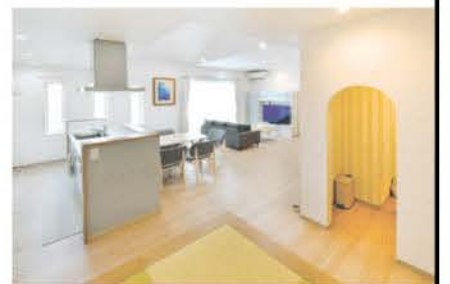
階段下空間を利用して愛猫のトイレを設置。寝室へ自由に入出りできる猫扉も付けた

定で十分。足元も寒くならない」と、ご主人は高い断熱効果を実感する。エアコンをつけていない時の寒さの質が違うという。断熱材には高性能セルローズファイバーを標準仕様。防音効果もあり、屋外の喧騒も全くというほど気にならない。さらに初期費用ゼロ円で太陽光発電システムを搭載でき、発電した電気が定額で使い放題の「エネ得放題」を採用。昼間の電気代を気にせず使用できるため、これから迎える夏も楽しみだという。「家族はもちろん、猫にとっても快適な環境の住まいができた」とご夫妻はほほ笑んだ。