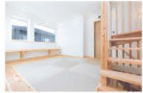
■ 畳敷きの2階は多目的フロア