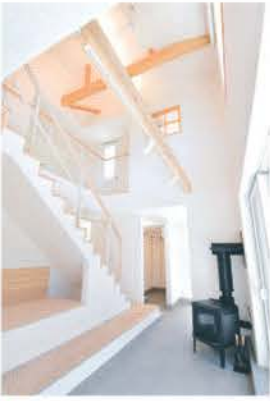
■ 階層をつなぐ開放的な吹き抜け