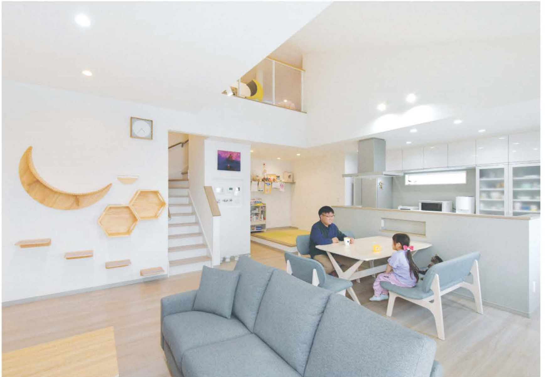
吹き抜けのある明るく開放的なLDK。壁面にはキャットステップを設置。滑りにくい床材や階段の高さを低くするなど、愛猫も快適に暮らせるよう随所に工夫を凝らしている