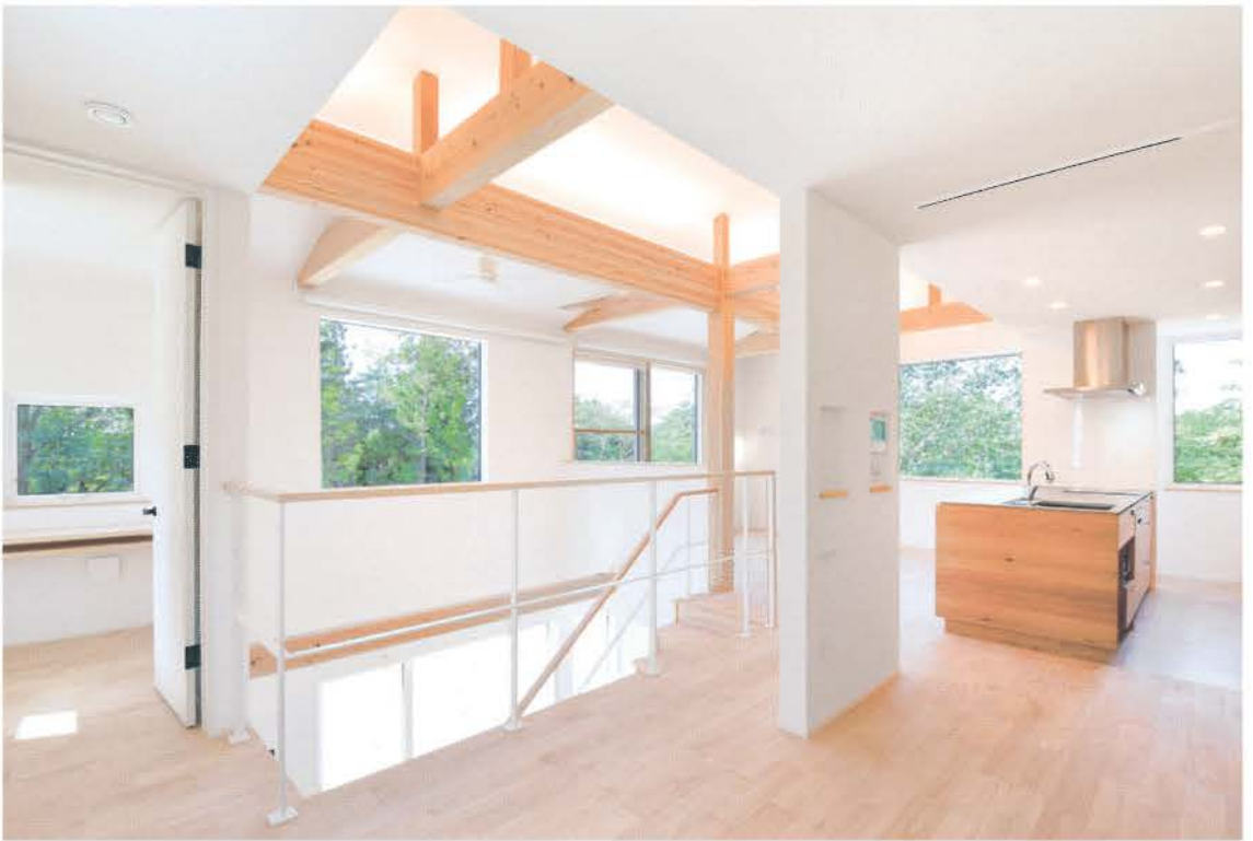
開放感あふれる2階リビングは開口の先に視線が抜け、明るさと豊かな緑を室内に取り込む。柱や梁は現し。床には栗の無垢板を張り、壁や天井には鎌倉漆喰を塗った。自然素材に満たされた居住空間。要所にアイアンや真ちゅうを用いた施主のこだわりが感じられる。