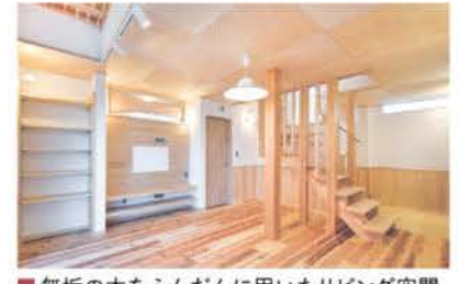
■ 無垢の木をふんだんに用いたリビング空間

階段にはスキップフロアが併設され、子どものプレイルームや秘密基地のような低天井の多目的空間のほか、階段下収納も備わる。1カ所で作業が完結する洗面脱衣室は家事負担を軽減してくれる。自然素材のぬくもりとハイスペックな省エネ性のどちらも妥協したくない人に同社の家づくりをぜひお勧めしたい。