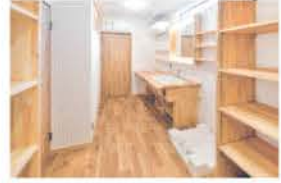
■ 造作収納が豊富な洗面脱衣室