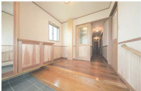
■木の香り漂う玄関ホール。床はぜひたくに張った檜の無垢板