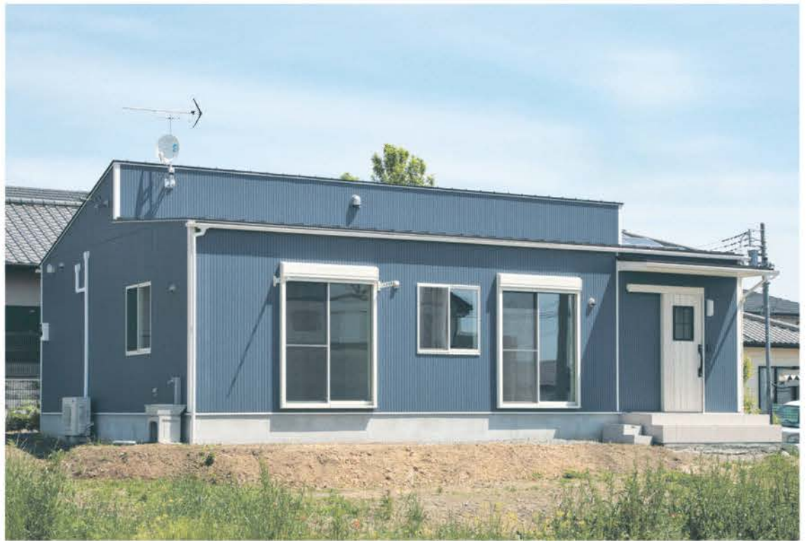
デザイン性も優れた注文住宅。家事動線を考え、使い勝手良く設計されている。コストを抑え、かつ品質を諦めない「無理がなく、ストレスのないマイホーム造り」を提案。面で支える2×4工法の強さも魅力。土地探しやローンの設定も得意だ。