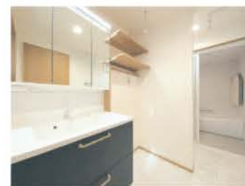
キッチンと隣り合わせに水回りがあり、家事楽な動線を実現

ご夫妻が望んだのは、家族のつながりを大切にしたい住まい。LDKと2階を吹き抜けでつなぐことで、どこにいても家族の気配を感じながら過ごすことができる。日当たりの良い三角窓の2階フリースペースは、家族みんなのお気に入りだ。