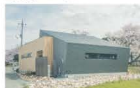
■建築家と造るデザインカーサ