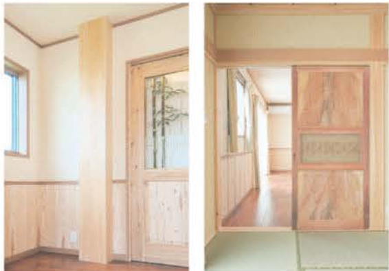
■存在感のある檜1尺の大黒柱 ■組子を用いた丹精な造作建具