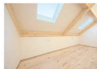
2階の子ども部屋。天窗から自然光が降り注ぎ明るい。仕切れることもできる

は気が付かない歴史や土地の良さを生かしてくれ、本当に感謝しています」と満面の笑みで語ってくれた。