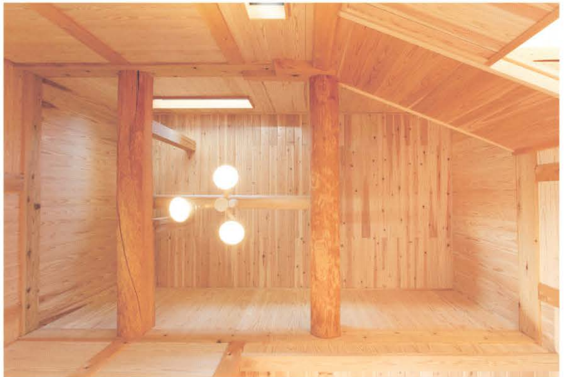
伝統の板倉工法で建てた平屋の住まい。県産材100%にこだわった地産地消の家で、現しの無垢材に囲まれて懐かしさとぬくもりを感じる。天井を見上げると、太い大黒柱と梁が家を頑丈に支えているのがよく分かる。