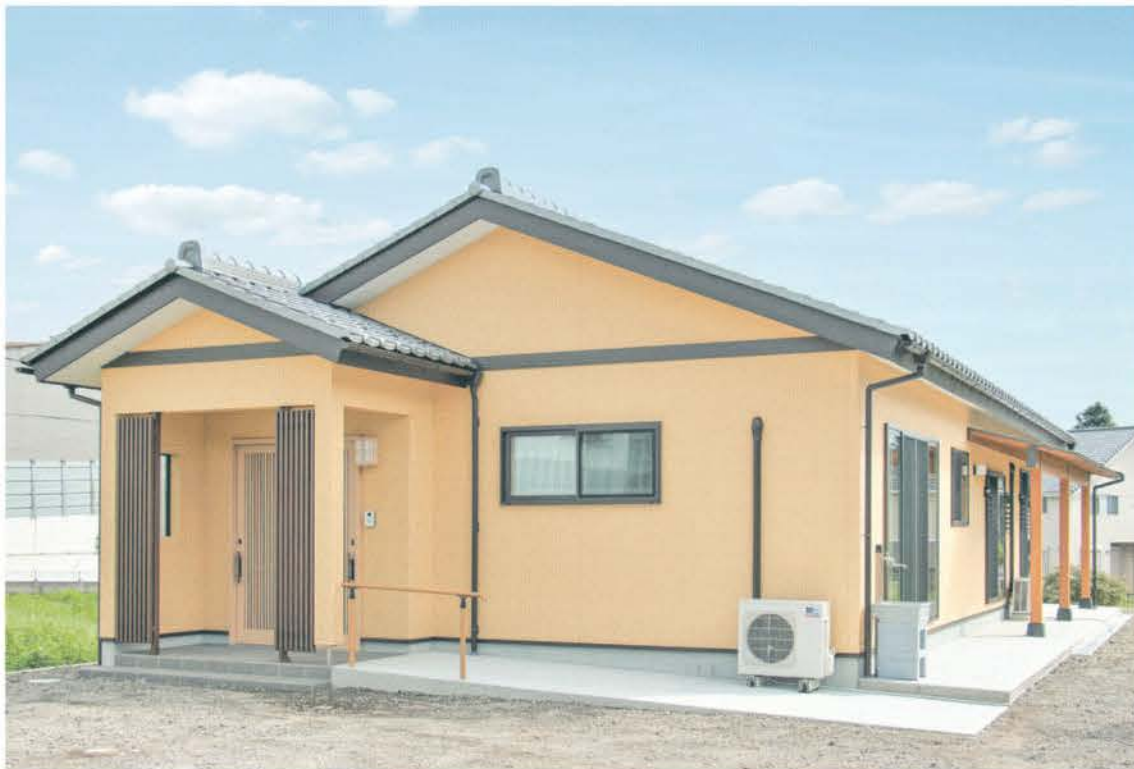
伝統の意匠と現代の高性能が融合した平屋の「木造骨太住宅」。檜の床、檜の大黒柱、年輪の模様が美しい杉の根元を用いた見事な格天井など、さまざまな樹種を適材適所に配置。壁には調湿効果のある珪藻土を使用。夏は涼しく冬は暖かい高気密・高断熱住宅。