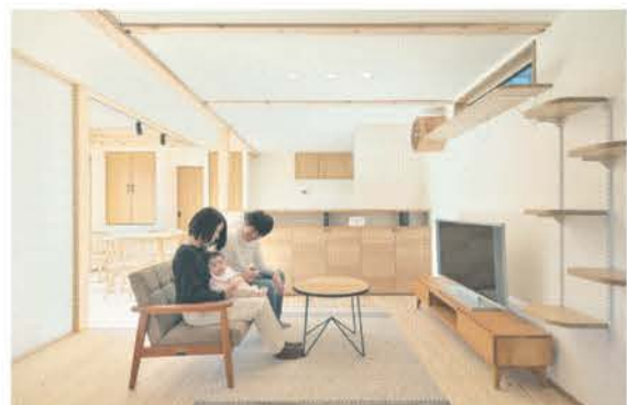
■木の香りが心地よい吹き抜けのあるリビング