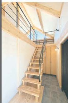
玄関引き戸を開けると吹き抜けが出迎える。床はパーナ-仕上げの御影石

切妻屋根と大きな三角窓が青空に映えるM邸。外観はシックなダークグレーの板張りだが、引き戸の玄関を開けると木をふんだんに使った吹き抜けのある明るい住空間が広がる。