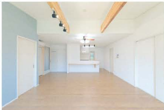
■ 広々としたLDK。ライフスタイルや好みに合わせた自由設計