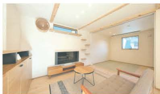
LDKとつながる和室。家族で使うウォークインクローゼットもあり便利

吹き抜けのあるLDKは、和室とひとつながりにし、将来は子どもを遊ばせながら家事ができるようにした。愛猫が日なたぼっこできる窓やステップを設けたほか、収納下を活用した猫用のトイレには臭い対策として換気扇を設置。見えない所まで暮らしや