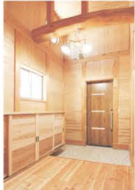
■ 木の世界へいざなう玄関ホール