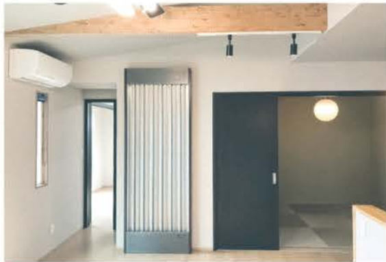
■ 輻射(ふくしゃ)式冷暖房システム「ecowin(エコウィン)」