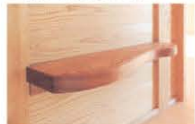
■ ケヤキの1枚板で造った棚