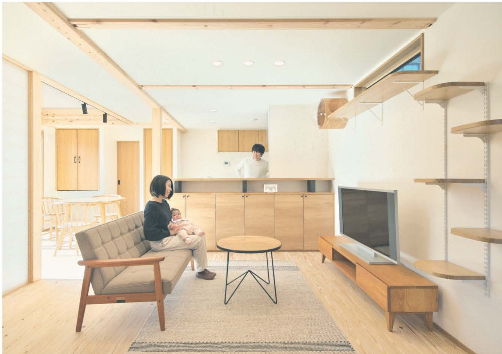
木の温もりに包まれるLDK。猫と快適に暮らすアイデアが詰まっている。障子越しに見る庭がご夫妻のお気に入り。収納も充実