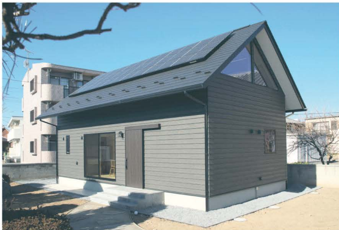
切妻屋根と大きな三角窓、グレーの板張りの外壁がシンボルの「カーサアマーレ」。日本古来の伝統美と最先端の建築技術が融合し、木の温もりを感じる平屋のように暮らせる住まい。日本の美の原点である「大和比」が採用され、日本の風景にもよくなじむ。