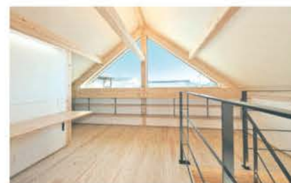
三角窓が見守るフリースペース。北側はご主人の書斎になっている