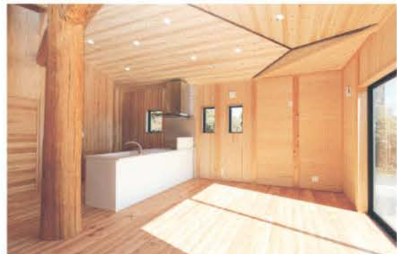
■ 太い梁が見どころのLDK。真っ白なキッチンを配置