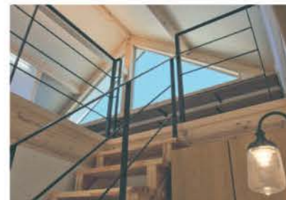
■リビングと2階をつなぐ吹き抜け階段

ばれる日本人が最も美しいと感じる比率が取り入れられ、平屋のようなシルエットでありながら2階は家族構成や生活スタイルに合わせてカスタマイズできる。資金計画から相談に乗ってくれるので、まずは無料相談会に参加してみよう。