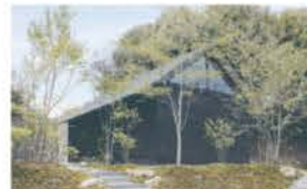
■人気のカーサアマーレ