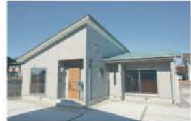
■ 板倉工法で建てた平屋