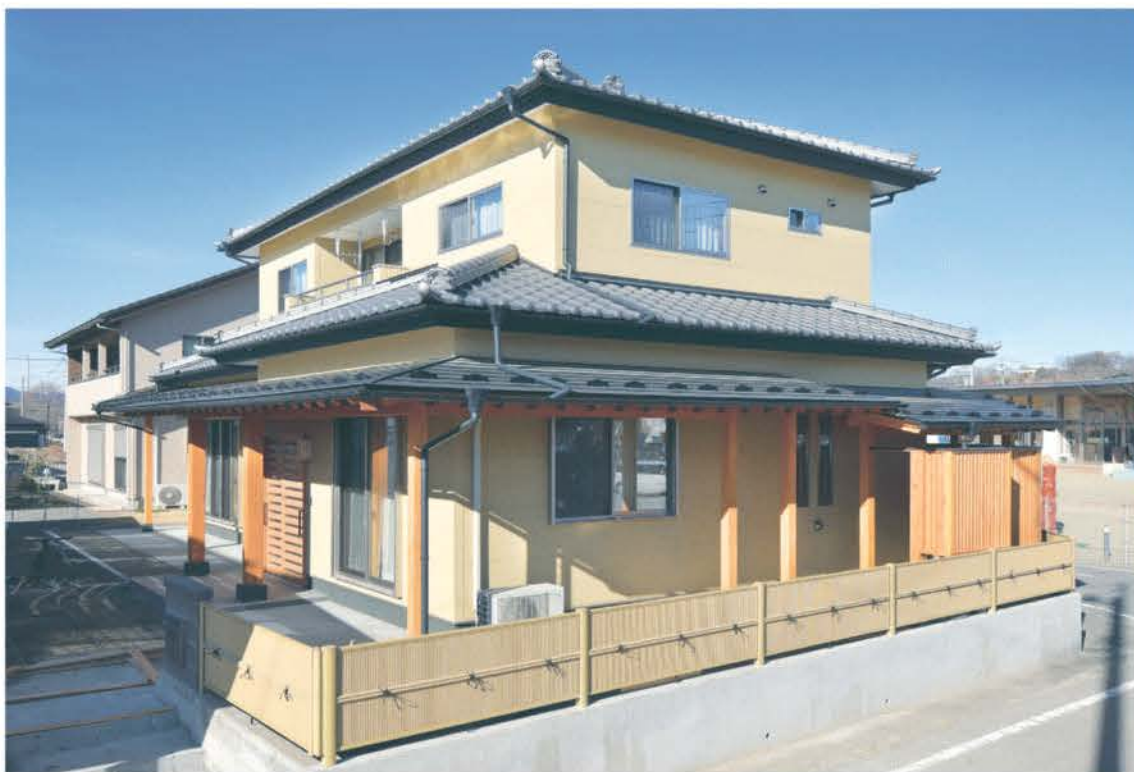
ひと際目を引く数寄屋造りの外観。屋根には三州瓦をふき、装飾の鬼瓦など和の魅力が凝縮されている。建物と一緒に外構も施工することで統一感をもたらし、家が一層引き立つ。地盤調査から改良工事、基礎工事も自社で手がける。