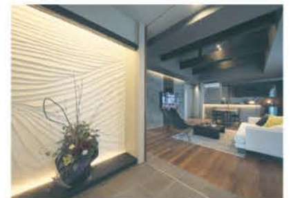
■ 左官仕上げの波打つ壁面がアクセント

が取り囲む個性的な配置。自由設計の本領が遺憾なく発揮されている。内部に展開する伝統的な和の造作とモダンな空間との融合は、新しい住まい方を提案し、一見の価値がある。家づくりのトータルアドバイザーとして土地探し、資金計画にも応じる。