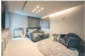
■ 広い寝室に間接照明が映える