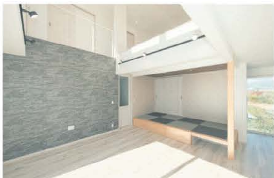
■ 自然光が降り注ぐ吹き抜けのリビング