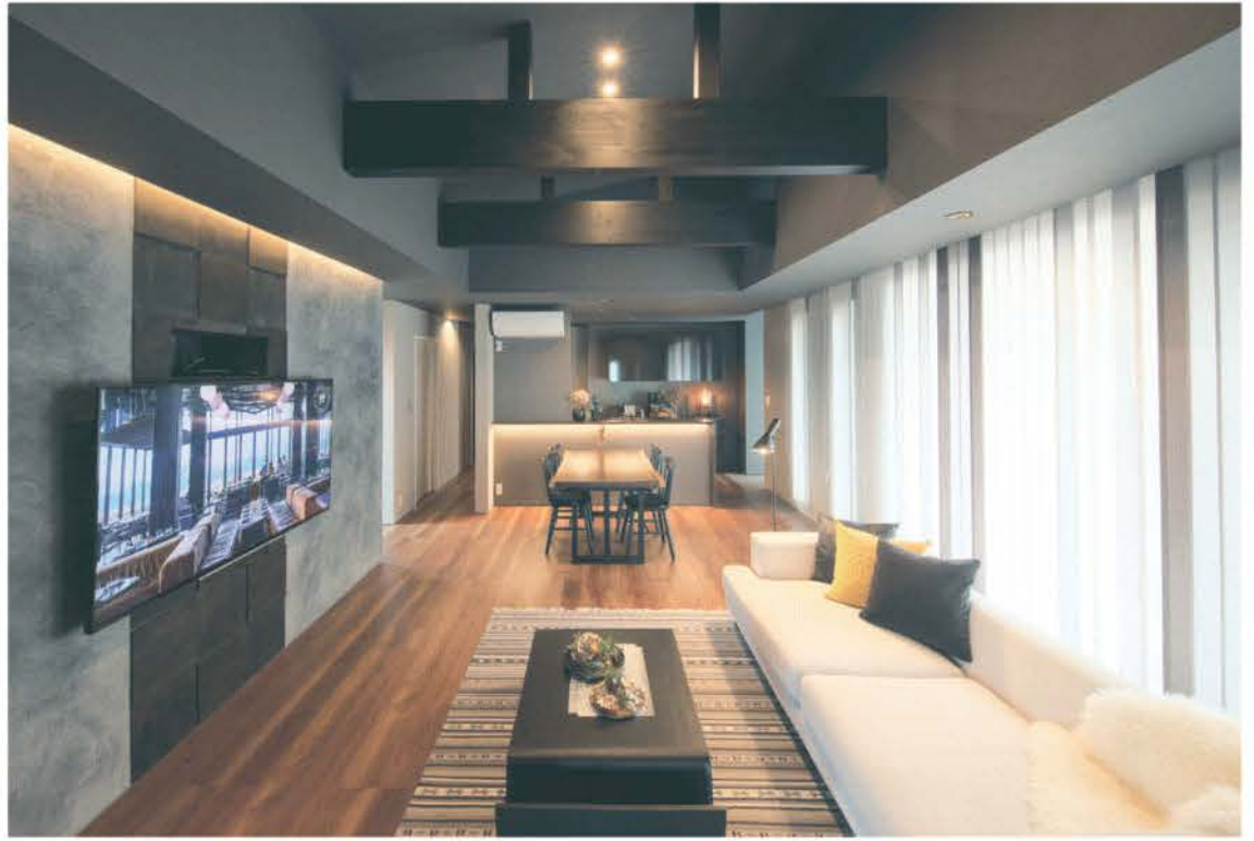
太田市藪塚町の平屋モデルハウス。シンプルモダンをベースに上質な住まいを提案。落ち着いた「大人モダン」な居住空間には、左官壁や格子戸など随所に和の要素を取り入れた。間取りや動線、収納にも工夫を凝らし、妥協のない意匠性と快適な居住性を両立。