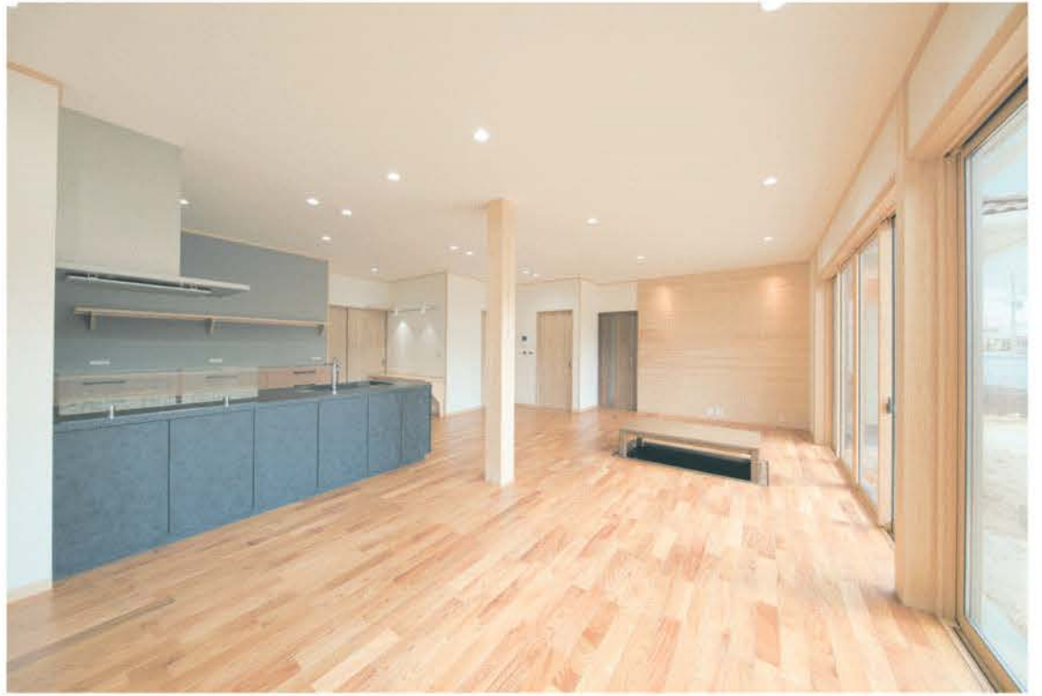
同社の和モダンモデルハウスを訪れ、建てることを決めた施主の家。30畳のLDKは、2.7倍の天井高でより広さを感じる造り。高い断熱性能に加え、全面床暖房と掘りごたつで、暖かさが持続する空間になった。