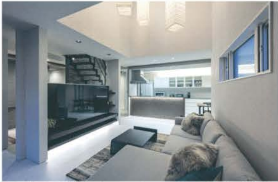
■ 吹き抜けが立体感を生み、モノトーンで統一したモダンな空間