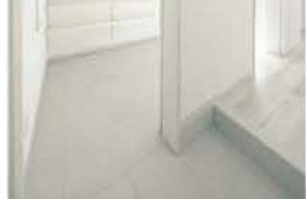
■ シューズクロークのある玄関