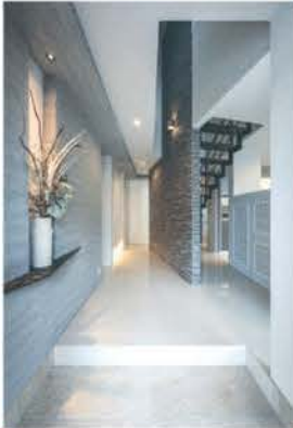
■ タイル敷きの玄関ホール