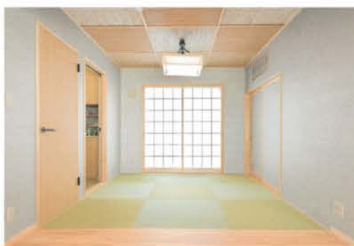
リビングとの段差をなくし空間が連続する端正な和室。壁には和紙を張った

家。室内は間仕切りのない伸びやかなワンフロア。勾配天井と床に無垢板を張り、建具や家具に至るまで職人の手作業が光る。くつろぎのリビング空間には縁なし畳に掘座卓を設け、コーナーには念願の薪ストーブを導入した。大きな開口部にはオーダーメイドの木製サッシを採用。潤沢な陽光を取り込み、野菜畑の風景を眺められる。連続するウッドデッキは、ご主人が農作業の合間にひと休みできる憩いの場だ。