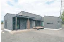
■ 斬新な平屋モデルハウス外観