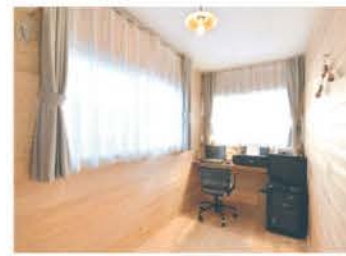
床と壁に無垢板を張ったご主人の書斎。カウンターテーブルは厚みのあるチークを使用

「とにかく家の中が暖かい」とご夫妻は喜ぶ。無垢板の床のぬくもりが心地よく、冬でも素足で歩ける。建物の断熱性が高いから夏はエアコン1台で十分。窓を開けると風通しも良く快適という。昨年6月から新居で暮らし始め、セカンドライフを満喫しているご夫妻。「朝早く起きて家の前の畑で作業をして、昼に戻って食事をしたら5時までまた