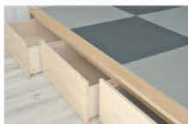
■ 小上がり和室の床下収納