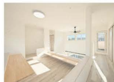
■ カウンターを設けた2階スペース

なアドバイスも好評で、口コミ客からの依頼が多いというのも納得だ。設計も自在で、現場でも柔軟に融通を利かせてくれる。近年はリフォームにも力を入れ、水回りの交換から大規模な工事まで請け負う。「リフォームも見積額で比べてください」と呼びかけている。