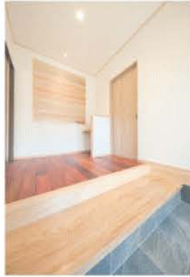
■ 床にカリンを用いた玄関