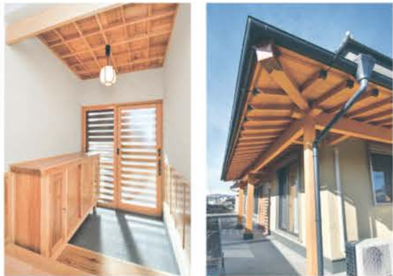
■ 職人技の格天井と造作靴入れ ■ ヒバや杉で組み上げた軒裏