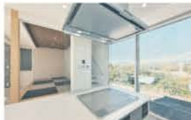
■ 景色の抜けを楽しむキッチン