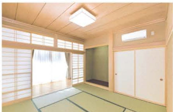
■ 源氏襖や雪見障子、檜の床柱などが美しい和室