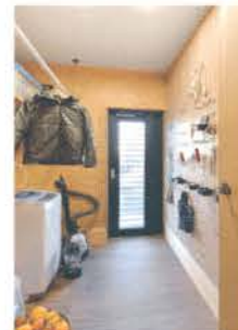
物干しハンガーや壁面に有孔ボードを設けた土間。収穫野菜も置いて便利

畑。あとはお風呂に入ってゆっくり。夜に薪ストーブの火を見るのが楽しみ」と、ご主人は一日のルーティーンを明かす。「物はなるべく増やさず、育てた野菜を食べて健康でシンプルな暮らしを続けていけたら」と、奥さまも平穏な日々を楽しんでいる。