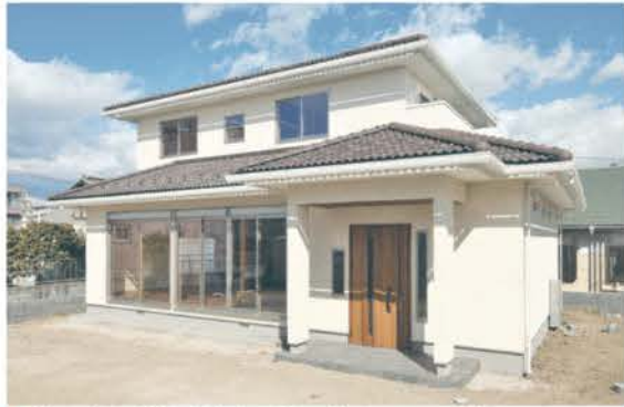
■ 洋モダンな外観。乳白色の壁にブラウンの瓦が映える