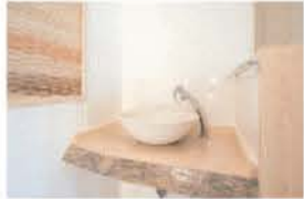
■ 一枚板の手洗い台が目を引き