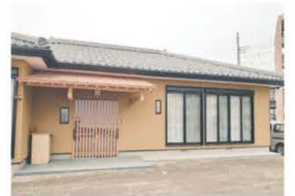
■ 平屋の受注も増え続けている

屋根はフェルトと遮熱材の二重構造にした上で本瓦をふき、外壁には断熱や防音、耐久性に優れたパワーボードを使用する。断熱は高性能グラスウールを採用。省エネ性を高め、メンテナンスコストを抑えつつ、災害にも強い家づくりを実現している。