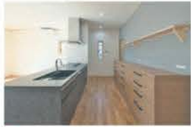
■ 収納豊富な3口コンロのキッチン