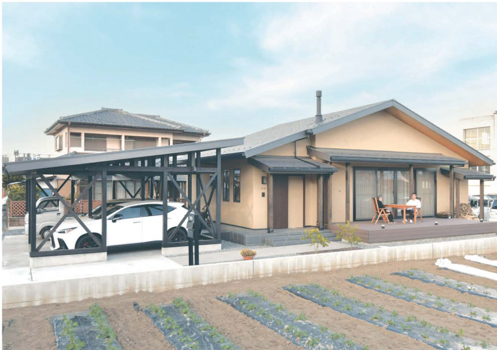
重心を低くした和モダンな外観デザインの平屋。大屋根と連続するようにダイナミックなガレージが調和する。畑を眺めながらウッドデッキでくつろげる