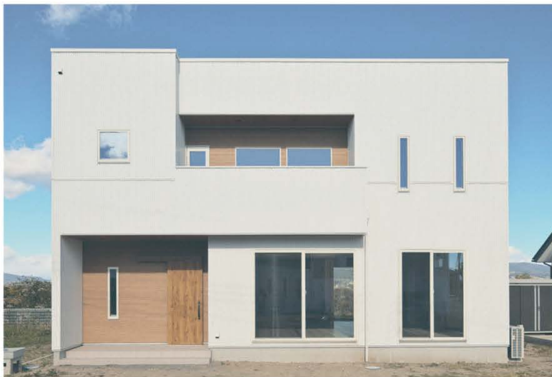
デザイン性の高いシンプルモダンな2階建て。吹き抜けの開放感が心地よく、配色もすっきりとまとまっている。「地元の渋川市は子育てしやすいエリア。生活の利便性や暮らし方も相談して」と呼びかけている。