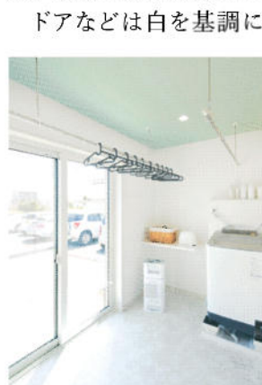
空色のアクセントが効いた洗濯機のある便利なサンルーム

壁掛けテレビをすっきり見せるために、「テレビのための壁」を造り、コードやレコーダーはテレビ裏に全部隠して収納できる間取りにした。壁には配線が通せるように穴が開けられ、将来の機器交換も容易にできる。