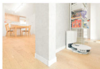
テレビ配線や、お掃除ロボットなどがまるごと隠せる便利な収納スペース

かでも、ご夫妻がこだわったのは、外からの視線を感じずに趣味のサッカー観戦が楽しめるリビングだ。