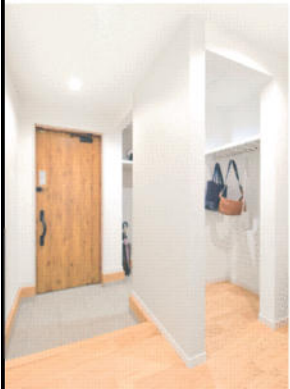
2way玄関は使いやすく、リビング・洗面室にも直行できる

ダークブラウンのスタイリッシュな外観に広くて使いやすい玄関ポーチ。K邸は注文住宅ならではのこだわりを詰め込んだ平屋の住まいだ。リビングの65インチテレビは存在感があり、迫力ある大画面でご夫妻の趣味のサッカー観戦が楽しめる。