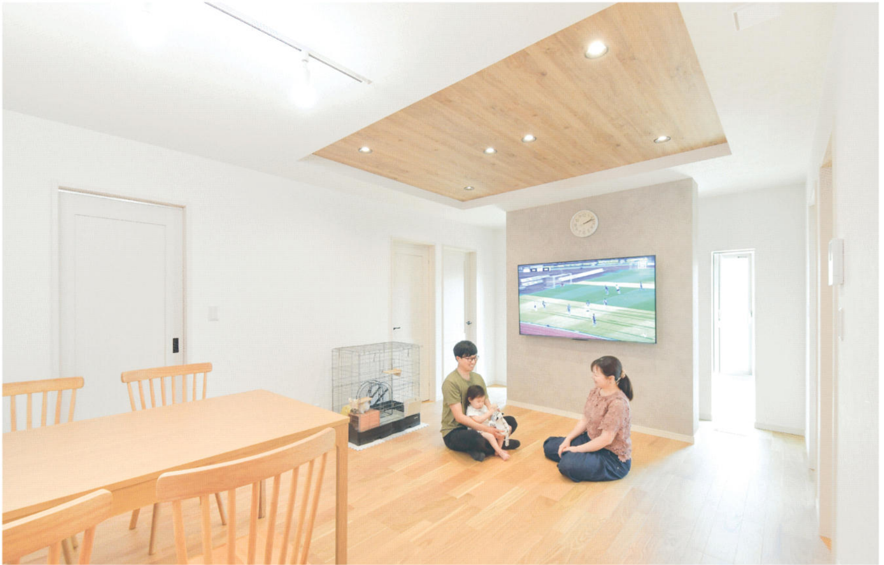
大画面で迫力あるサッカー観戦が楽しめるスタイリッシュなリビング。地元チーム「ザスパクサツ群馬」を応援!

■ 建築面積 / 95.02㎡ (28.74坪) ■ 延床面積 / 89.22㎡ (26.98坪) ■ 建築工法 / 木造軸組+パネル工法 ■ 完成日 / 2023年5月