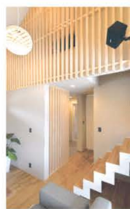
無垢木材のルーバーを通し空間の軽やかさを演出

いつでも見学を受け付けており、予約が必要。間取りや設備などの住宅に関するだけでなく、太