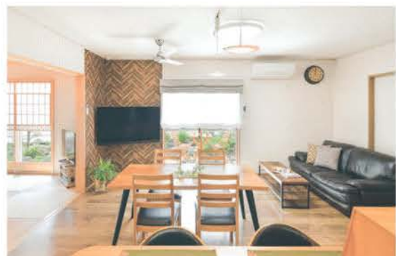
■明るく開放感のあるLDK。ヘリンボーン柄の壁がアクセント