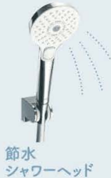
節水シャワーヘッド