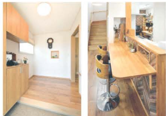
■温かな木質感の玄関ホール ■会話を楽しむキッチンカウンター