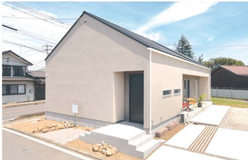
日当たりのよいテラスとロックガーデン