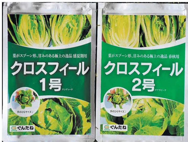
栽培するジャムレタスの種袋

栽培計画では、菜園の大きさ(幅1.5畝、奥行き2畝)に合わせて、2畝弱の畝を2本作り、