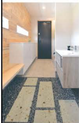
化粧砂利を敷いた土間。飛び石には大谷石を使用

三角屋根のシンプルな外観とは対照的に、木や石などの自然素材を要所に活用した温かみのある室内。LDKは、間仕切りがなく吹き抜けの開放感が感じられる。