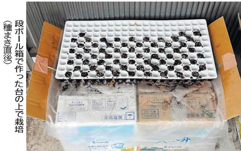
段ボール箱で作った台の上で栽培(種まき直後)