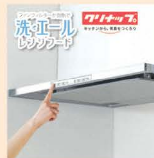
自動洗浄レンジフード