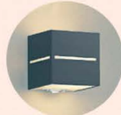
LED玄関 センサーライト