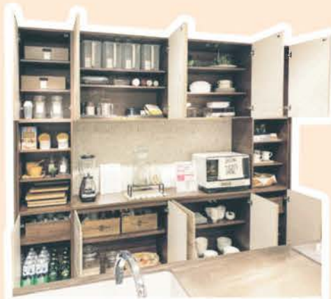
大容量! カップボード