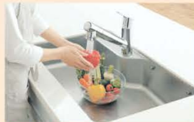
浄水器一体型水栓