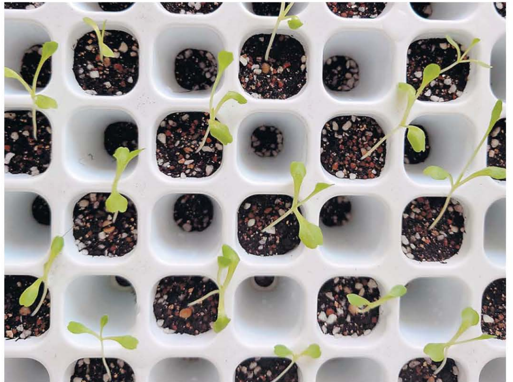
発芽後に茎が伸びてしまったジャムレタス

5月下旬に開設した「すみかくらぶ家庭菜園」で土づくりがほぼ終わり、野菜の本格栽培を始めたところで、失敗をしてしまった。事件は、農業に関わる商品全般を扱う会社、ぐんたね(渋川市吹屋)のオリジナル野菜「ジャムレタス」の種まき後に起きた。発芽して喜んでいたら、細い茎がよきによき。レタスなのに茎を伸ばしてしまう失態。ぐんたねから「やり直しの命」が下った。どうやら、夜に水をやり過ぎたのが原因らしい。