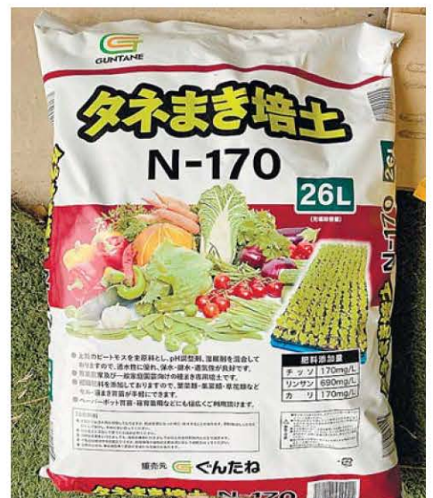
種まきで使った培土(ぐんたね)