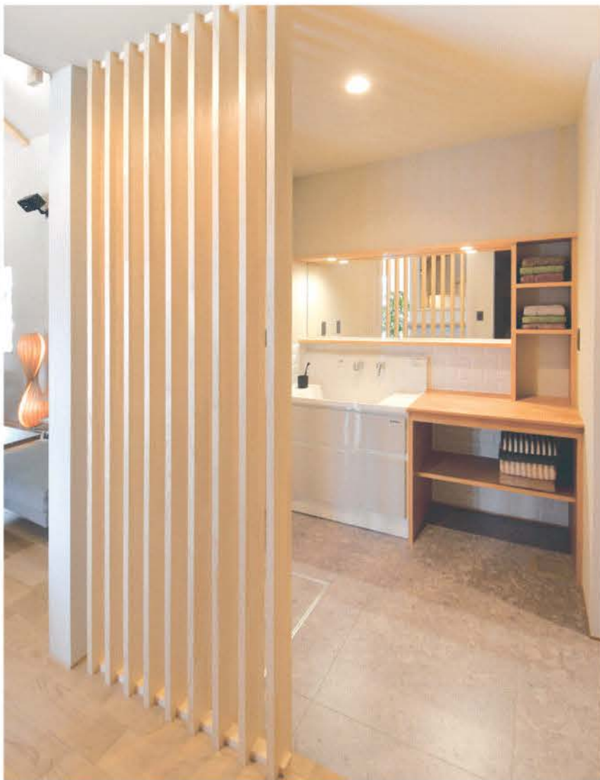
既製品と造作を組み合わせることで、使い心地のよさとデザイン性を兼ね備えた洗面室

■建築面積 / 83.63㎡(25.24坪) ■延床面積 / 106.81㎡(32.24坪) ■建築工法 / 木造軸組工法 ■完成日 / 2023年4月