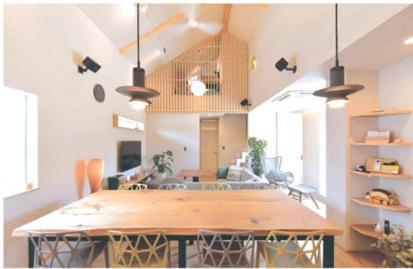
勾配天井で、広がりのある空間に