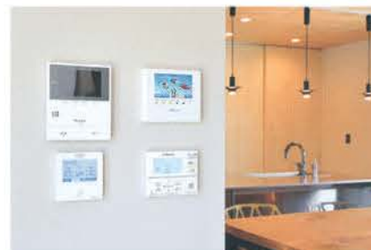
電気の発電量や使用量などを「見える化」