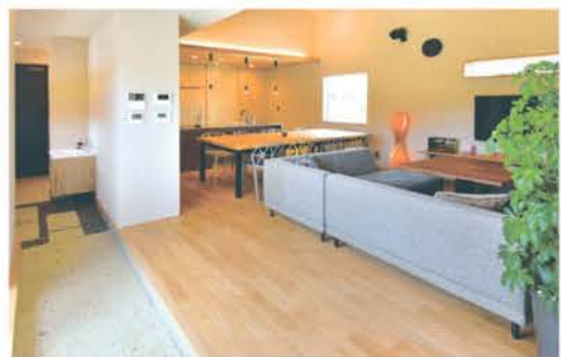
「趣味の時間を楽しんで」と設計された、自由度の高い間取り

や寒さ、電気代に悩む方へ「次世代の家づくり」に必要なことを知ってほしいと思い、モデルハウスをつくりました」と話す。長期の住宅ローン組む人も多いからこそ、長く快適に暮らせる家づくりの知識を知ってほしいという。