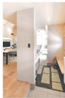
外空間をイメージした土間が玄関とLDを継ぎ目なく繋ぐ

陽光や省エネに関する相談にも幅広く対応する。「疑似停電体験」もでき、スマートハウスとEVの連携を目で見て実感できると好評だ。防災や環境について考える学びの場として、家族で展示場を訪れてみよう。