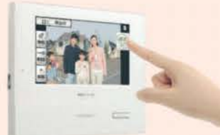
ワイヤレス モニターホン

玄関ドアはデザインも豊富で、カバンやポケットにリモコンキーがあればドアハンドルのボタンを押すだけで施錠可能。またスマホやドアホンからも施錠解錠が出来ます。